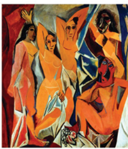
Les demoiselles d'Avignon - Picasso