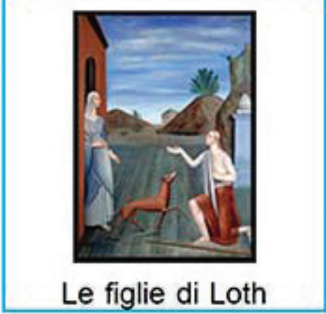
Le figlie di Loth